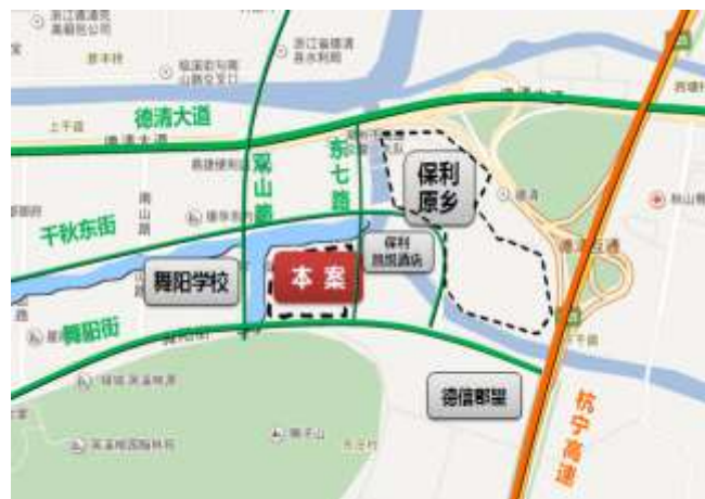
項目地理位置示意圖