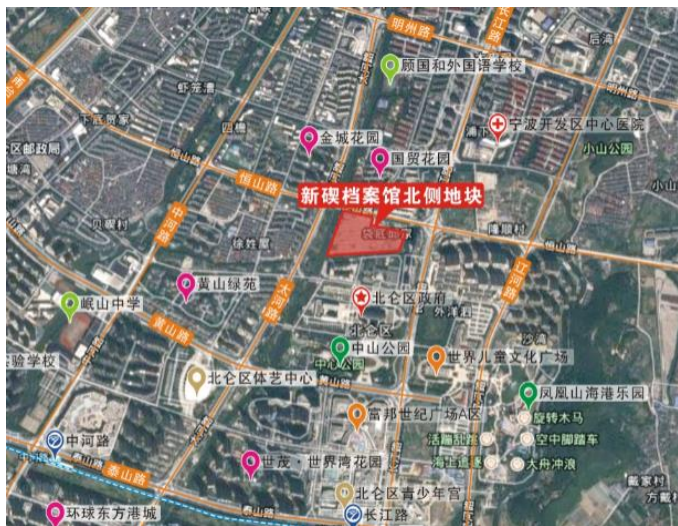
项目地理位置示意图