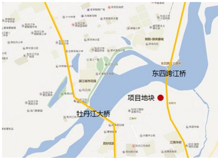
项目地理位置示意图