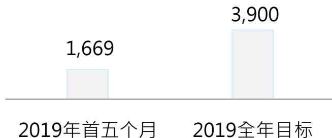
新开工面积 (千平方米)